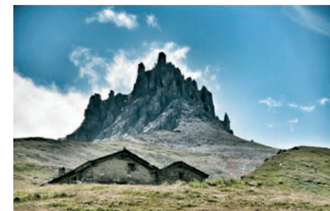
Imaginez un château